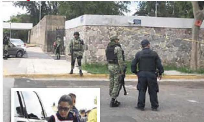
GUADALAJARA, Jal.- Cuatro personas resultaron heridas ayer luego de que un grupo armado irrumpiera en la Asamblea Distrital de Morena.