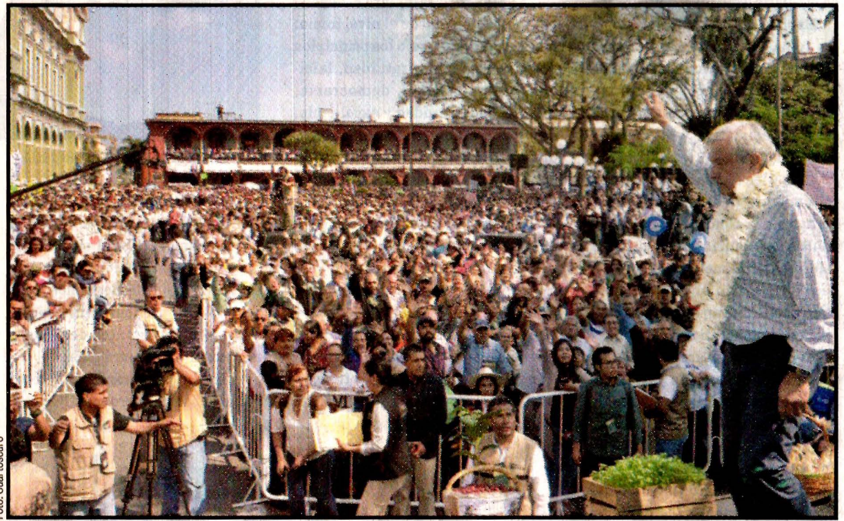
CORDOBA, Ver.- Andrés Manuel López Obrador. Apoyo a productores.