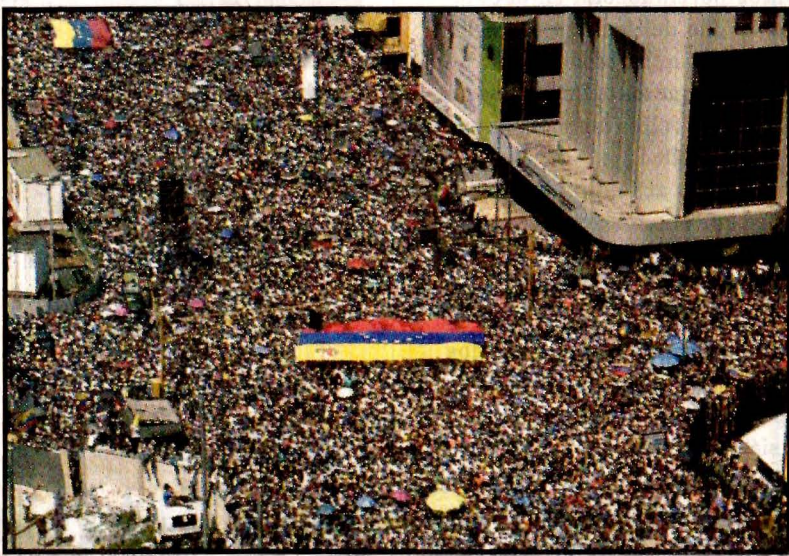
CARACAS, Ven.- Sigue la medición de fuerzas entre opositores y oficialistas.

El mandatario estadounidense agregó que rechazó reunirse con Maduro, quien asegura que Washington encabeza un intento de golpe de Estado en su contra para apoderarse de la