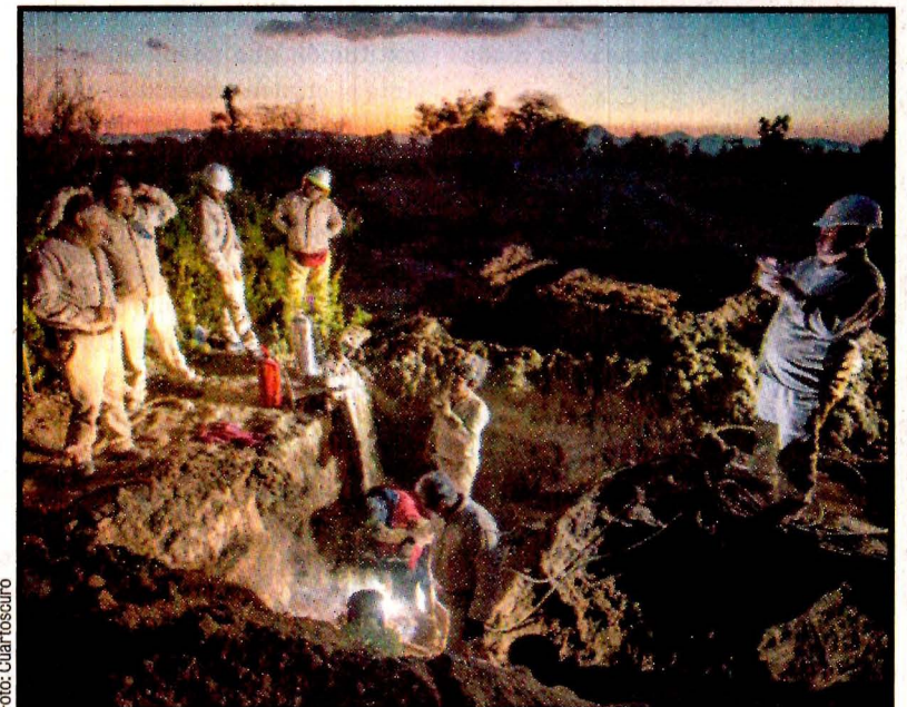
TLAHUELILPAN, Hgo.- Una cuadrilla de trabajadores de Pemex labora sin descanso para clausurar tomas clandestinas en los ductos de la paraestatal. No cesan los piquetes en toda la red nacional.