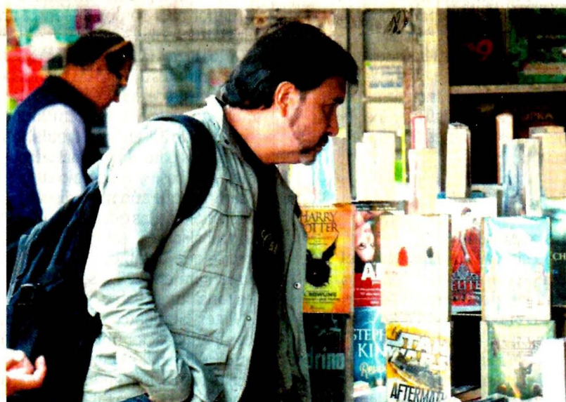
En la Ciudad de México se decomisaron 412 mil 250 piezas entre 2007 y 2018, señala la Fiscalía General de la República.

Además, existe un pobre registro en el país sobre el aseguramiento de estos libros. De 2007 a 2015, la Procuraduría General de la República (PGR, hoy FGR) decomisó 388 mil 802 textos piratas.