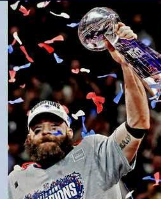
Edelman, el jugador más valioso del Super Bowl.

Durante todo el encuentro manifestaron su preferencia con ensordecedores gritos cuando atacaban los Rams, con la intención de evitar que el joven pasador, Jared Goff,