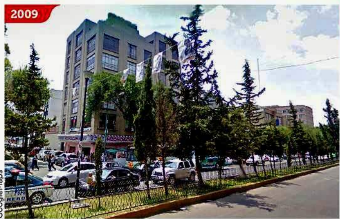
Así lucía Buenavista y Puente de Alvarado antes de la apertura de la Línea 4 del Metrobús. En total se tiraron 394 árboles para esa obra.