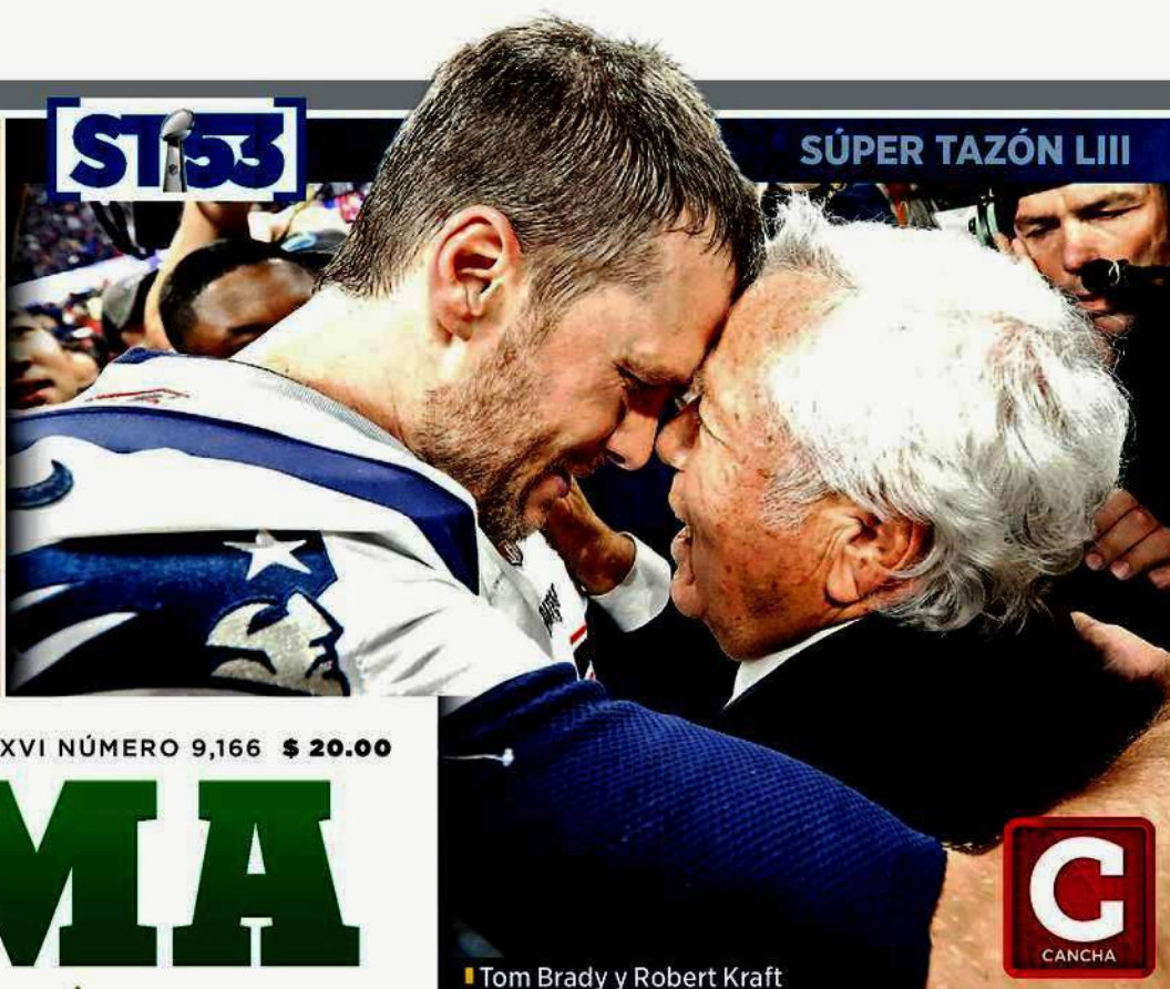
Tom Brady y Robert Kraft