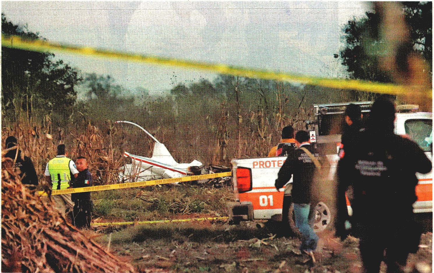
El gobierno federal informó que la aeronave era rentada y volaba hacia Ciudad de México; PGR atrae la investigación y pide no especular.