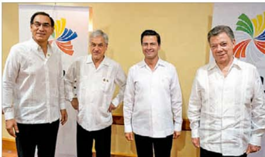
El presidente Enrique Peña Nieto posa con sus homólogos de Perú, Martín Vizcarra; de Chile, Sebastián Piñera; y de Colombia, Juan Manuel Santos, en el marco de las actividades de la XIII Cumbre de la Alianza del Pacífico, en Puerto Vallarta.

La decisión final sobre el NAIM se dará en diciembre, anuncia AMLO