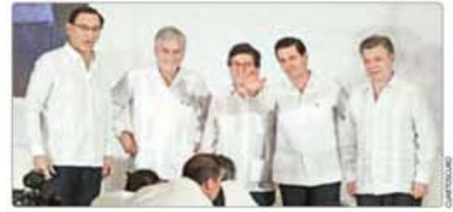
ABATIR LA DESIGUALDAD, EL RETO: EPN MÉXICO P. 5

El jueves reinician las mesas de negociación: los equipos de Peña y AMLO trabajarán por primera vez juntos. Mañana viene a México, Chrystia Freeland, representante de Canadá, en las negociaciones, y visitará la casa de transición de López Obrador MÉXICO Y NEGOCIOS P. 4 Y 14