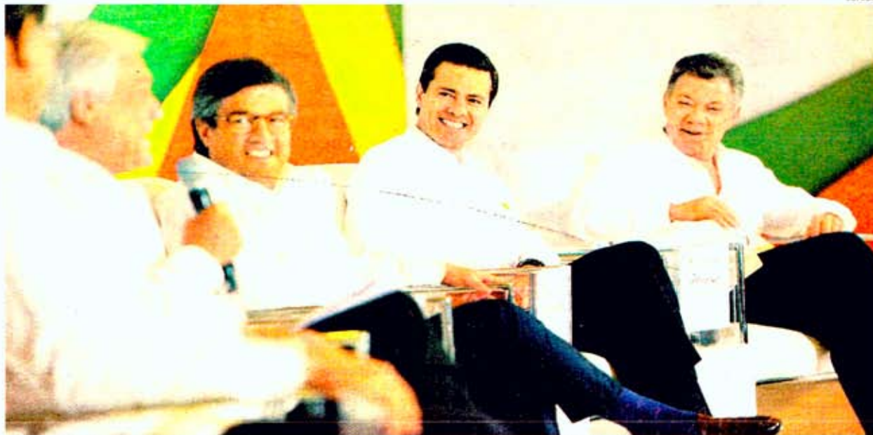
El presidente Enrique Peña aseguró que el principal reto de la Alianza del Pacífico es que su modelo ayude a cerrar las brechas de desigualdad.

GÓMEZ FARIÁS, CHIHUAHUA Alcalde electo pide al narco que le pare y le devuelva a su padre P. 14 Y 18