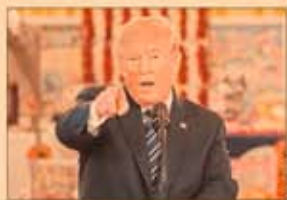
Trump leyó la carta que le mandó AMLO.