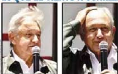
Andrés Manuel López Obrador. El año, en su conferencia.