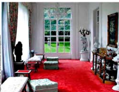
La residencia, ubicada en una zona de alta plusvalía, tiene obras de arte y muebles y accesorios decorativos de lujo.