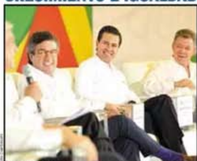
PUERTO VALLARTA, Jal.- Sebastián Piñera, Martín Vizcarra, Enrique Peña y Manuel Santos. Cumbre de la Alianza del Pacífico, Crecimiento e igualdad, los retos de México.