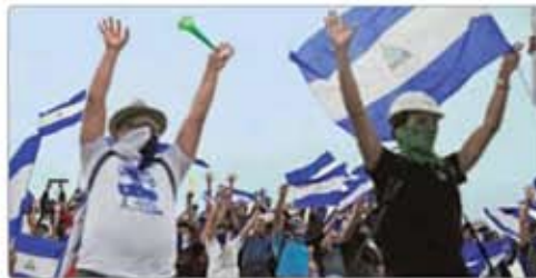
VEN A ORTEGA MÁS CRUEL QUE A SOMOZA MUNDO P. 14

◆ En una entrevista con 24 HORAS, declara que se debe hacer un ejercicio de verdadera autocrítica, junto con todo el priismo, para ver “quiénes queremos trabajar adentro de nuestra organización y quiénes a lo mejor ya ni están”. Anuncia la convocatoria para coordinar a los priistas en el Senado MÉXICO P. 3