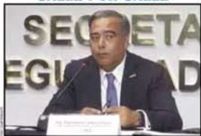
Raymundo Collins, nuevo titular de la SSP CDMX. Ya no será estrategia de cuadrantes.