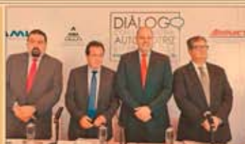
La industria automotriz presenta sus demandas.

Automotrices plantean a López Obrador cuatro ejes de trabajo. P24