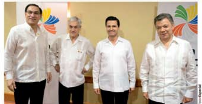
LOS PRESIDENTES Martín Vizcarra, de Perú; Sebastián Piñera, de Chile; Enrique Peña, de México; y Juan Manuel Santos, de Colombia, ayer.

Mandatarios de Colombia, Chile y Perú respaldan señalamiento; plantean que Alianza del Pacífico sea antítesis de proteccionismo de Trump. pág. 9