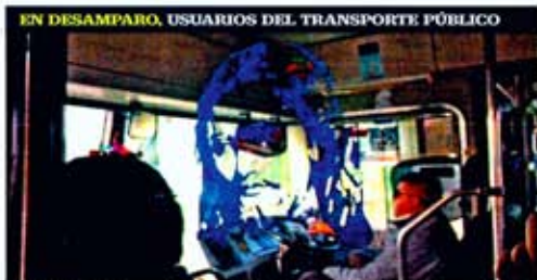
El Estado de México se ubica en el primer lugar nacional en el robo a usuarios del transporte público en los últimos tres años, de acuerdo con autoridades.