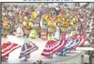
OAXACA, Oax.- Primero de los lunes del Cerro. Es el festival de La Guelaguetza.