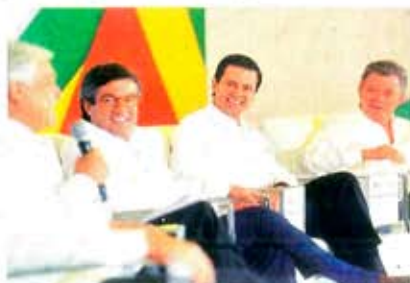
Enrique Peña Nieto asistió el panel de clausura de la cumbre en compañía de sus homólogos de Chile, Colombia y Perú. El evento fue moderado por el presidente del Banco Interamericano de Desarrollo (BID), Luis Alberto Moreno.

"La ventana de oportunidad que se abre es la con el equipo de transición del virtual presidente electo, Andrés Manuel López Obrador, pues estamos enfrentando esto con una sola visión del Estado mexicano".