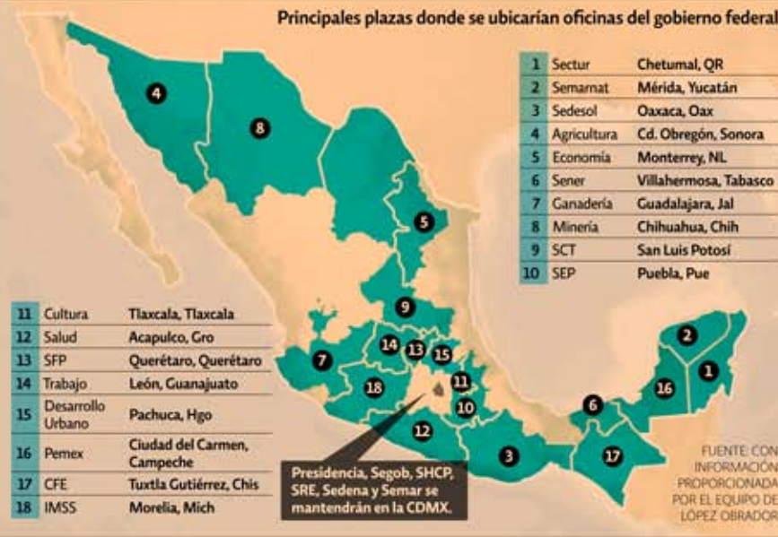
Principales plazas donde se ubicarían oficinas del gobierno federal