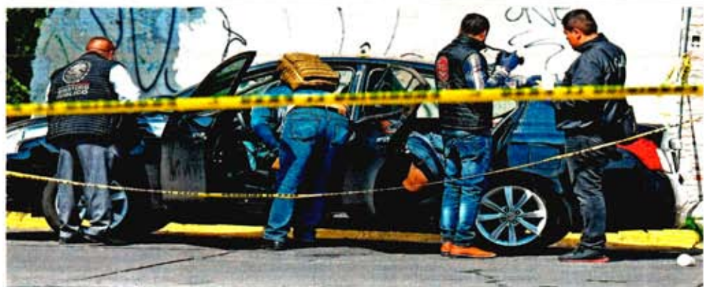
Personal del Ministerio Público y Servicios Policiales acordonaron la zona donde seis hombres asesinados fueron encontrados en un vehículo abandonado.