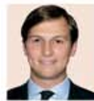
Jared Kushner Asesor de la Casa Blanca