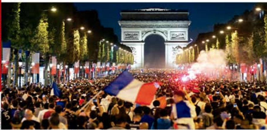
MILES DE FRANCESES festejaron en grande, ayer, en Campos Elíseos, el triunfo de su selección.