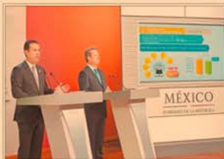
EL IMSS, con superávit, tendrá cabal salud hasta el 2030, anunció el director Tuffic Miguel. P26

Dólar rompe el piso de 19 pesos, ante posibilidad de que el Banxico endurezca su política monetaria. P4-5