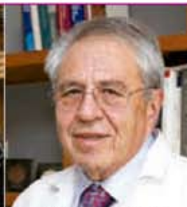
JORGE ALCOCER VARELA