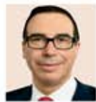
Steven Mnuchin Secretario del Tesoro