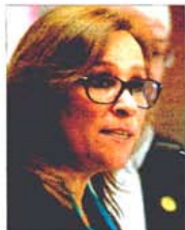
La próxima secretaria de Energía expuso a La Jornada que el Instituto Mexicano del Petróleo volverá a ser brazo tecnológico de Pemex.