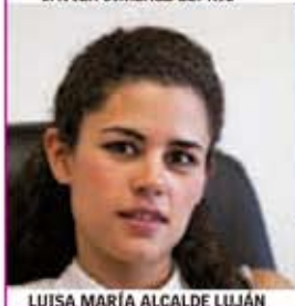
LUISA MARÍA ALCALDE LUJÁN