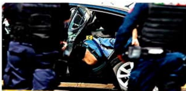
Los cadáveres de cinco hombres y una mujer fueron abandonados ayer en un auto en Neza.

gada del viernes fueron ejecutados a tiros dos hombres en la Colonia México Independiente.