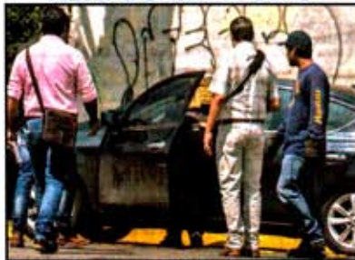
Un auto con seis cuerpos fue abandonado en Bosques de Aragón. En el lado de la portezuela fue escrita la leyenda "AntiUnión". Ver página 6