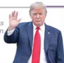
DONALD TRUMP Presidente de Estados Unidos

"La solución a la crisis de los niños separados de sus padres... es que no vengam a EU ilegalmente"