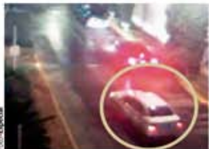
AUTO escolta (círculo) al coche en el que llevaban los cadáveres.

El grupo Fuerza Anti-Unión ahora abandona en los linderos de la ciudad, cuerpos de presuntos extorsionadores de La Unión de El Betito. pág. 13