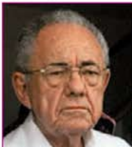
JAVIER JIMÉNEZ ESPRIÚ

En el extremo están los experimentados: Javier Jiménez Espriú (81 años), en la SCT; Olga Sánchez Cordero (71 años), en Gobernación; y Jorge Alcocer Varela (72 años), en la SSA.