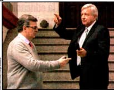
Andrés Manuel y Marcelo Ebrard. Detalles.

Andrés Manuel López Obrador anunció ayer que el presidente Donald Trump además de Mike Pompeo, secretario de Estado de Estados Unidos, enviará a nuestro país a Steven Mnuchin, secretario del Tesoro, para conversar sobre el plan de activación económica de México y el freno gradual de la migración ilegal a territorio estadounidense. La agenda de la reunión no incluye el muro fronterizo que Estados Unidos pretende construir entre ambos países pero sí la renegociación del Tratado de Libre Comercio de América del Norte (TLCAN). Dijo que en la conversación bicultural planteará la necesidad de incluir en el tema hemisférico, el desarrollo y el bienestar de los países y de los pueblos de Centroamérica. "Debemos entender las causas de la migración, la gente sale de sus países por necesidad no por gusto", por lo que debe trabajarse por el desarrollo de México y Centroamérica hasta la frontera sur de Panamá, afirmó. Marcelo Ebrard, quien será titular de la Secretaría de Relaciones Exteriores (SRE), en la misma conferencia anunció que vendrá a México también Jared Kushner, asesor y yerno de Trump, y de William Duncan, responsable de negocios de la embajada de EU en México. También participarán la secretaria de Seguridad Nacional, Kirstjen Nielsen. El encuentro será entre las 13:00 y 14:00 horas del viernes.