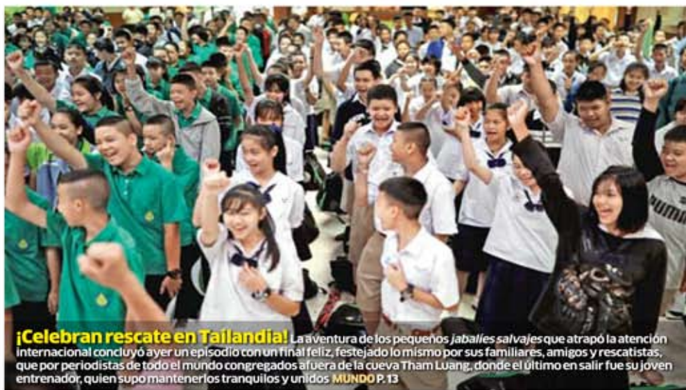
¡Celebran rescate en Tailandia! La aventura de los pequeños jabalíes salvajes que atrapó la atención internacional concluyó ayer un episodio con un final feliz, festejado lo mismo por sus familiares, amigos y rescatistas...