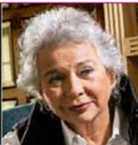
OLGA SÁNCHEZ CORDERO