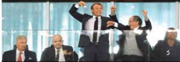
Ante el Rey Felipe de Bélgica (izq.), el presidente galo, Emmanuel Macron (centro), no pudo contentarse al celebrar el gol que le dio a la selección de su país el pase a la final del Mundial.

VENDE CARO SU AMOR Tras nueve años en el Real Madrid, Cristiano Ronaldo fichó con Juventus en una transacción que costó 112 millones de euros.