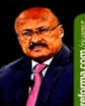
VIDEO DE LIBRE ACCESO

René Juárez dice no estar atado al cargo de dirigente del PRI y que en el momento que no sea útil al partido se puede ir.