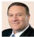
Mike Pompeo Secretario de Estado