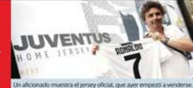
Un aficionado muestra el jersey oficial, que ayer empezó a venderse.

VENDE CARO SU AMOR Tras nueve años en el Real Madrid, Cristiano Ronaldo fichó con Juventus en una transacción que costó 112 millones de euros.