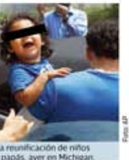
La reunificación de niños y papás, ayer, en Michigan.

El Presidente de EU dijo que la solución a la crisis de separación de niños es que las familias desistan de entrar a ese país de manera legal. PÁGINA 12