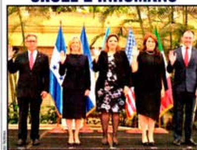
GUATEMALA, Guatemala.- Luis Videgaray y Kirstjen Nielsen. Acuerdo en defensa de los migrantes, desde Centroamérica. Ver página 5