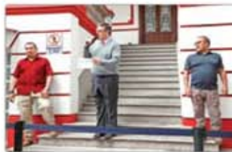
¿Y ELLOS QUIÉNES SON? Andrés Manuel López Obrador, próximo Presidente de México, y su equipo, ¿ya tienen quién los culde?

Antes, el secretario de Estado de EU se reunirá con el presidente Enrique Peña Nieto. Será la primera visita en medio de la crisis de los migrantes y una pausa en las negociaciones del TLCAN.