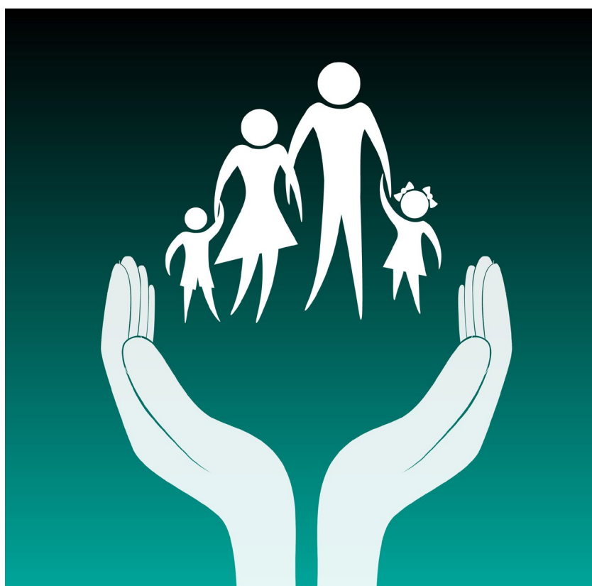
Semana Nacional de la Seguridad Social (Propuesta del GP de MORENA)