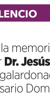
Sen. Héctor Laríos Córdova