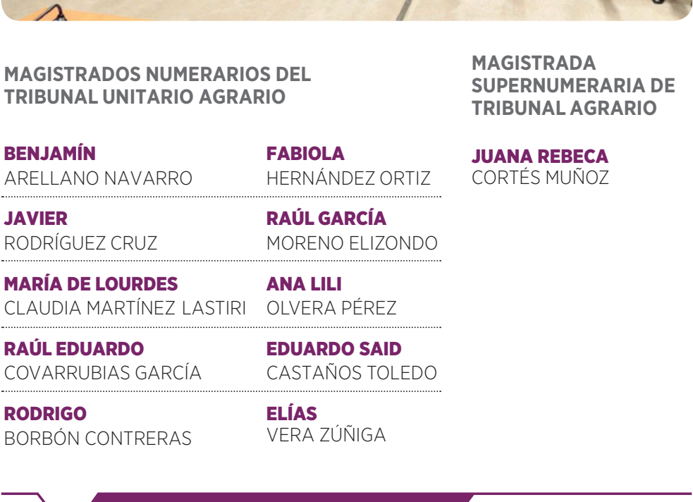
MAGISTRADOS NUMERARIOS DEL TRIBUNAL UNITARIO AGRARIO