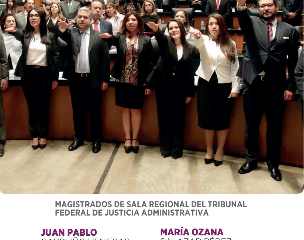
MAGISTRADOS DE SALA REGIONAL DEL TRIBUNAL FEDERAL DE JUSTICIA ADMINISTRATIVA