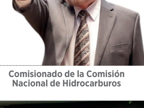
Comisionado de la Comisión Nacional de Hidrocarburos