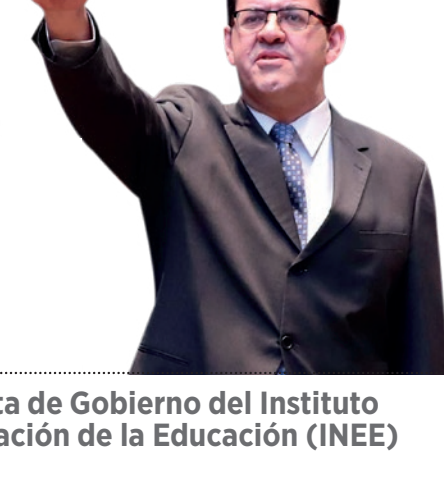
Consejeros de la Junta de Gobierno del Instituto Nacional para la Evaluación de la Educación (INEE)